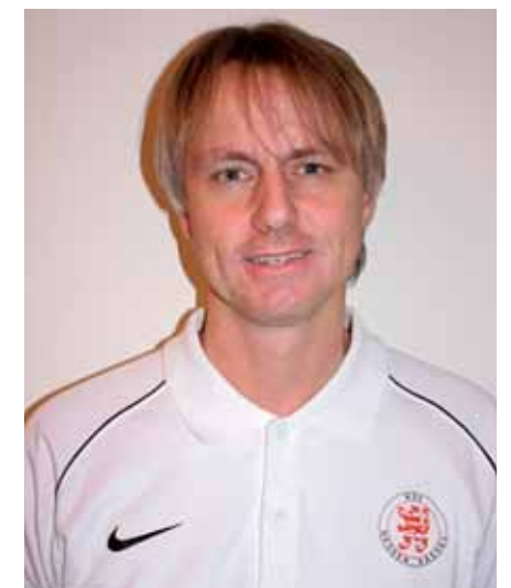
KSV-Nachwuchskoordinator Hans-Jörg Ehrlich

Das müssen Sie andere Leute fragen, aber ich hoffe so einiges. Auf alle Fälle hat die Jugendabteilung seit Oktober einen eigenen Bus, der dringend benötigt wurde