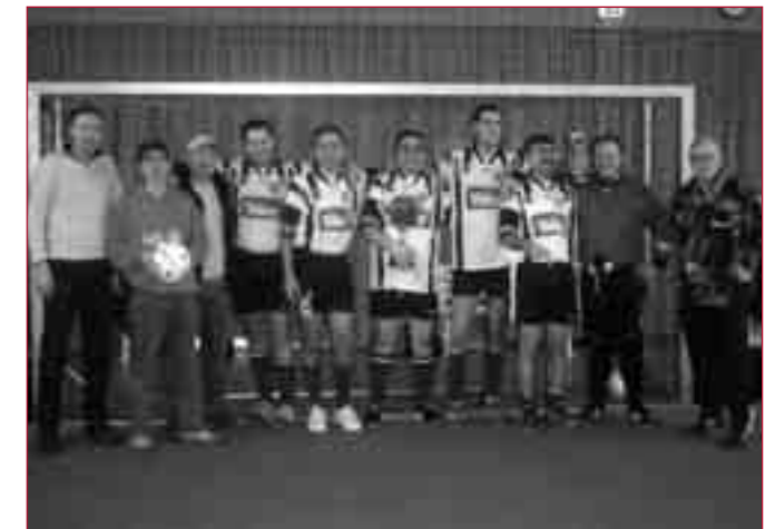
So sehen Sieger aus: Die „Haupttribünenhocker“ haben auch dieses Jahr den HEGA-Cup gewonnen.