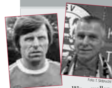
1982 „Wir wollen doch lieber beim Mannschaftstraining mitmachen“, widerriefen im Jahre 1982 vier Löwen-Spieler, sich selbst zu Miezekätzchen degradierend, ihre Entscheidung gegen das neu eingeführte Sonntagstraining. Die Alternative: eine

Sondereinheit unter ihrem mit 44 Jahren noch voll im Saft stehenden „Dompteur“. Und das war kein geringerer als Ex-Nationalspieler Timo Konietzka, der nicht nur als Schütze des ersten Tores der Bundesligageschichte im Jahre 1963 bekannt ist, sondern diesem legendären Tor allein in der Bundesliga 71 weitere folgen ließ und damit Borussia Dortmund und die 60er Löwen unter anderem zu zwei Deutschen Meisterschaften und dem DFB-Pokalsieg schoss. „Ich hatte nie ein Autoritätsproblem. Man hat es mir