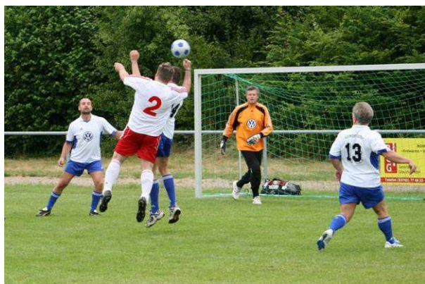
Ein Höhepunkt des Volkswagen Sachsen Cups: Der Betriebsrat spielte gegen das Management

Für eine gute Sache veranstaltete der Betriebsrat von Volkswagen Sachsen am 21. Juni das Benefizfußballturnier Volkswagen Sachsen Cup. Die Jugendmannschaften regionaler Fußballvereine spielten auf dem Sportgelände des SV Mosel um den Turniersieg. Das Turnier ist mittlerweile eine gute Tradition und bei den Vereinen der Region eine angesagte Veranstaltung. Aber auch für Nicht-Fußballfans gab es einiges zu entdecken: Bastelstraße, Kistenstapeln, Hüpfburg und viel Sport und Spaß zogen viele Kinder an. Gegen Spende wurden T-Shirts mit dem aufgedruckten »A chance to play«-Logo abgegeben.