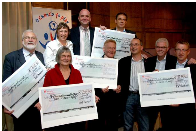
Einsatz für »A chance to play«: Bei der Feierstunde wurden zahlreiche Spenden überreicht

Die Aktion »Eine Stunde für die Zukunft – Volkswagen und Audi-Belegschaften helfen Kindern in Not« feiert in diesem Jahr ihr zehnjähriges Jubiläum. Aus diesem Anlass waren die Mitglieder des Weltkonzernbetriebsrates, von denen sich die meisten an der Aktion beteiligen, Vertreter von terre des hommes und Gäste aus aller Welt zu einer Feierstunde nach Kassel gekommen – Gelegenheit zur Rückschau, aber auch zum Blick in die Zukunft.