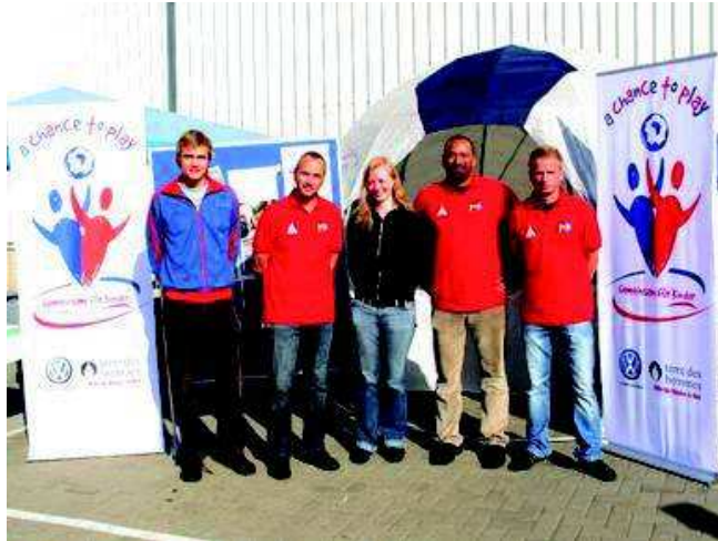
Tag der offenen Tür in Braunschweig: Der Betriebsrat sammelt für die Projekte in Südafrika

Mit vielen kleinen und großen Aktionen werden zurzeit am Volkswagen-Standort Braunschweig Spenden für Kinder in Südafrika gesammelt. Insgesamt konnten in den vergangenen Monaten