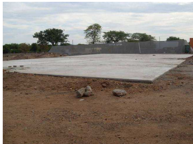
Große Veränderungen: Wo vorher nur Sand und Kies war, entsteht nun ein Volleyballfeld